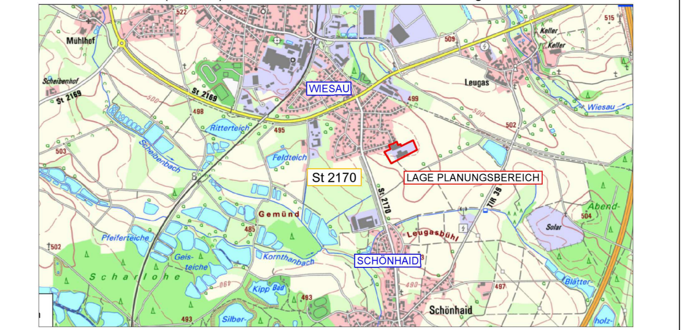
Übersichtslageplan M 1:25.000

MARKT WIESAU LANDKREIS TIRSCHENREUTH FLUR NR.: 335/8, 335/12 (TF), 410 (TF), 410/15, 410/16, 410/17, 907, 907/1 der Gemarkung Schönhaid, 4110/3, 4112, 4155 (TF) und 4 1 5 5 / 9 (TF) der Gemarkung Wiesau